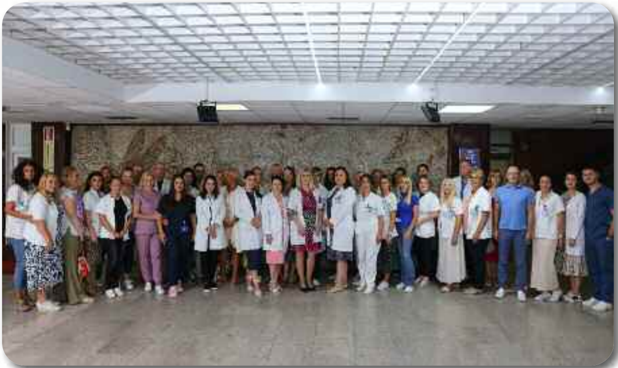
Служба за специјалистичко консултативне делатности