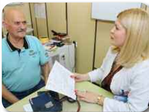
Интернистички преглед пацијената