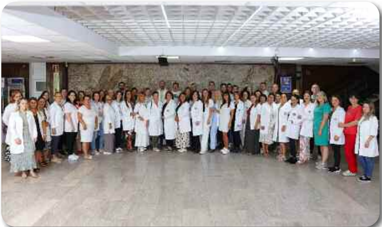
Служба за кућно лечење, медицинску негу и палијативно збрињавање