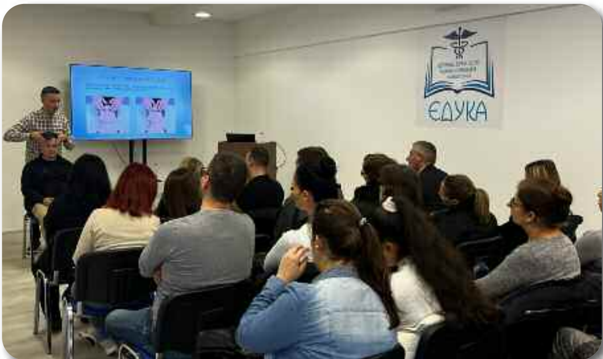
Континуиране медицинске едукације у новом простору “Едуке” у ул Војводе Танкосића