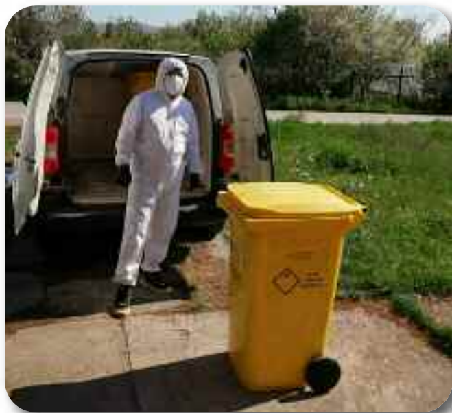
Третман инфективног отпада

Запослени у одсеку вешерај брину о хигијени радне одеће запослених у установи. У одсеку ради осморо запослених.