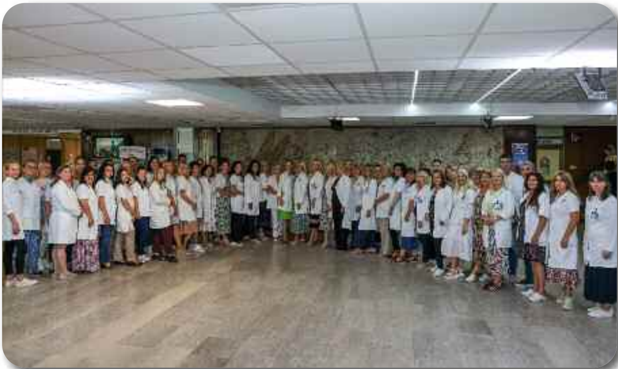
Одељење “Централни објекат”