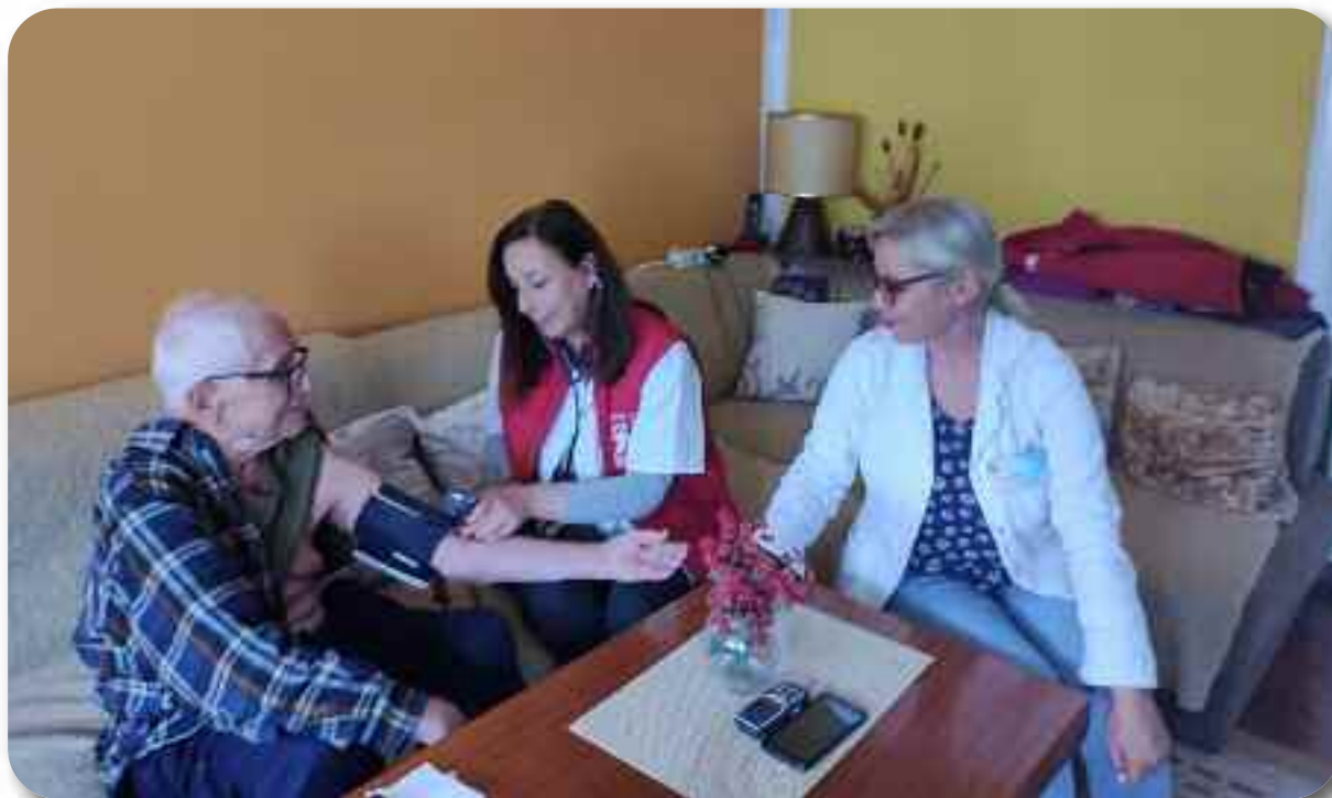
Тимски рад на терену