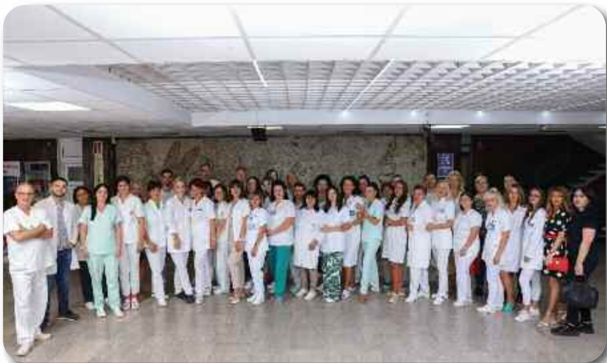
Одељење за здравствену заштиту у области денталне медицине одраслих