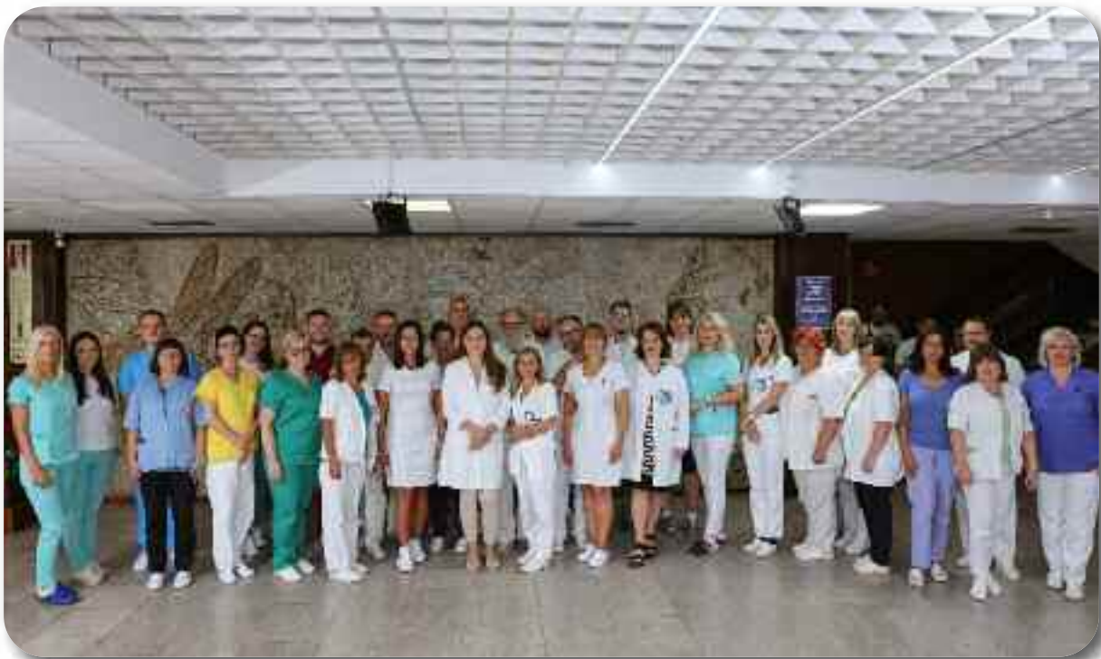
Служба за лабораторијску дијагностику