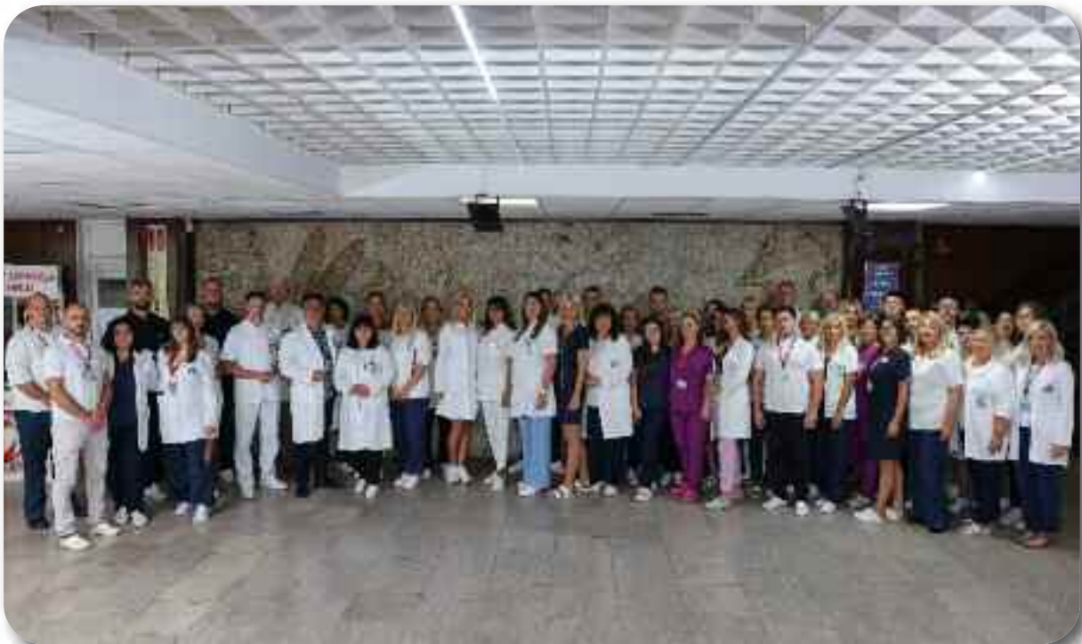
Служба за физикалну медицину и рехабилитацију