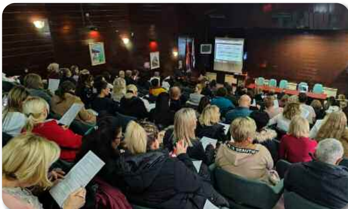
Амфитеатар Дома здравља Ниш

Жеља менаџмента и тима за едукацију је да се унапреди регионална сарадња као и сарадња између организација на примарном нивоу у Србији и тиме размене многа искуства стечена у земљи и иностранству, а све у циљу постизања бољих резултата у лечењу корисника на примарном нивоу као и примена најсавременијих процедура у дијагностици и терапији. Жеље нису нереалне, неопходно је само да постоји координација између свих тимова на нивоу здравствених установа.