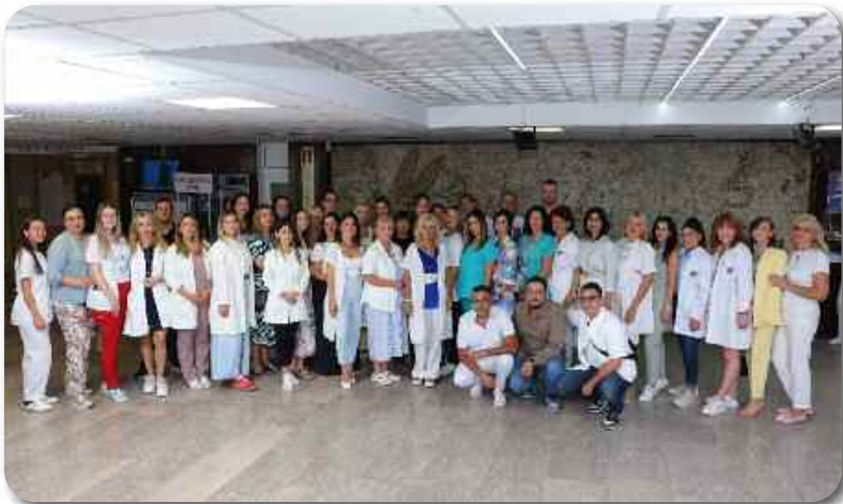
Одељење за здравствену заштиту у области денталне медицине деце