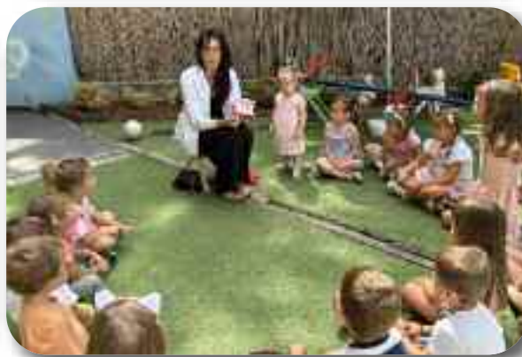
Превентивне акције, посета школама и вртићима