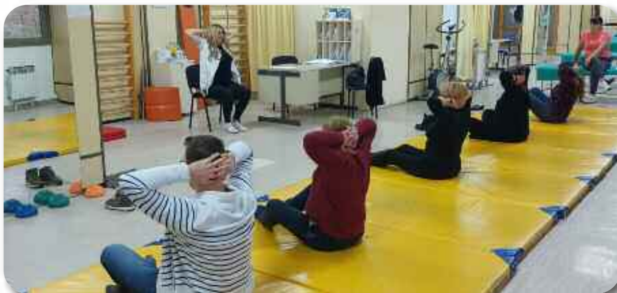
Групе вежбе у сали за кинезитерапију