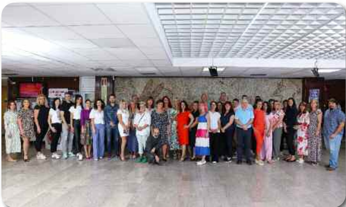
Служба за правне и економско - финансијске послове