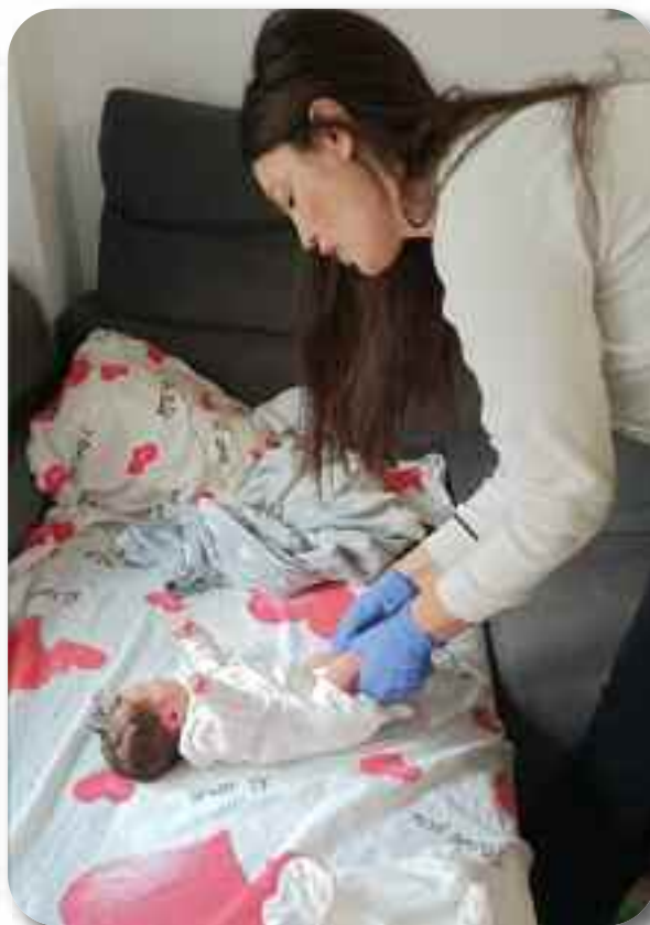
Посета патронажне сестре бабињари и новорођенчету