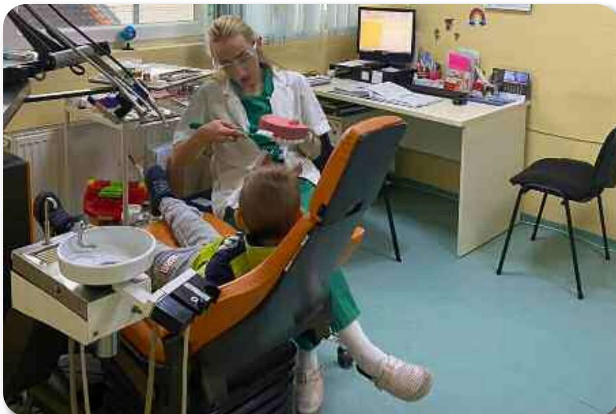
Амбуланта “Зубић вила”- преглед стоматолога

Тако је крајем 2023. године, као јединствен у целој Србији, отворен при Одељењу за здравствену заштиту у области денталне медицине за одрасле Превентивни центар денталне медицине за труднице и породиље. Циљ отварања овог центра је да се потпуно одвоји ова осетљива категорија становништва (труднице и породиље) од осталих пацијената у погледу не само превентивних прегледа, већ и санације зуба и усне шупљине.