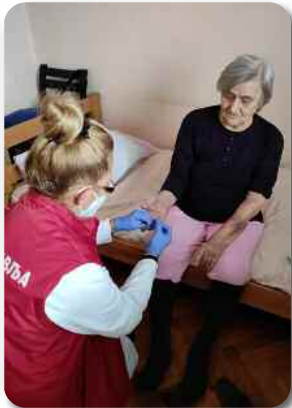
Мерење шећера у капиларној крви