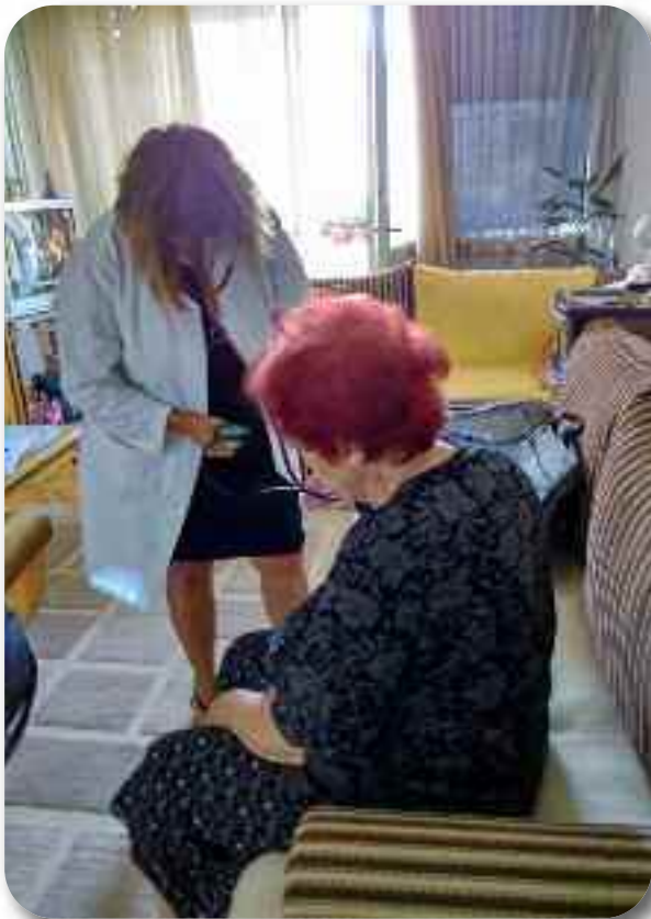
Преглед лекара кућне неге на терену

Сваке године се повећава број пацијената којима су неопходне услуге у кућним условима, тако да извршење Плана рада премашује број планираних услуга на годишњем нивоу.