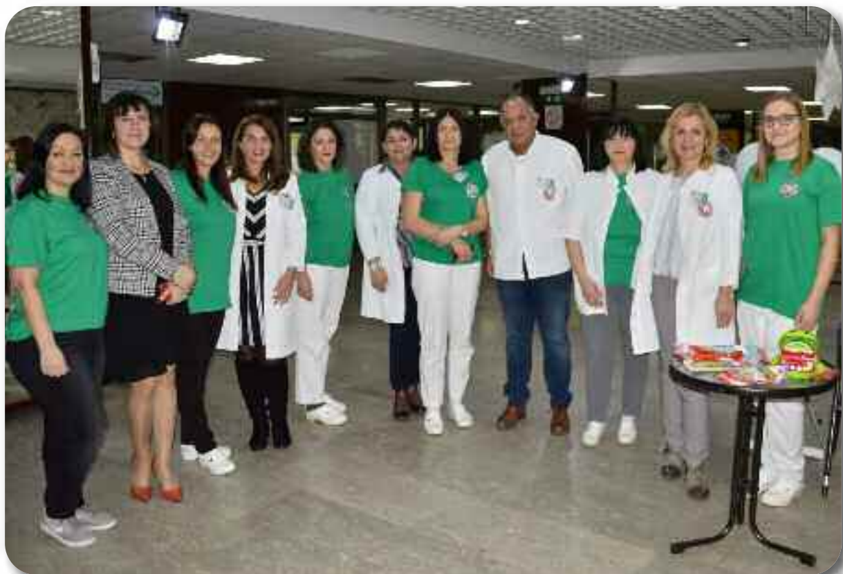
Акција “Здрави зуби, леви зуби”