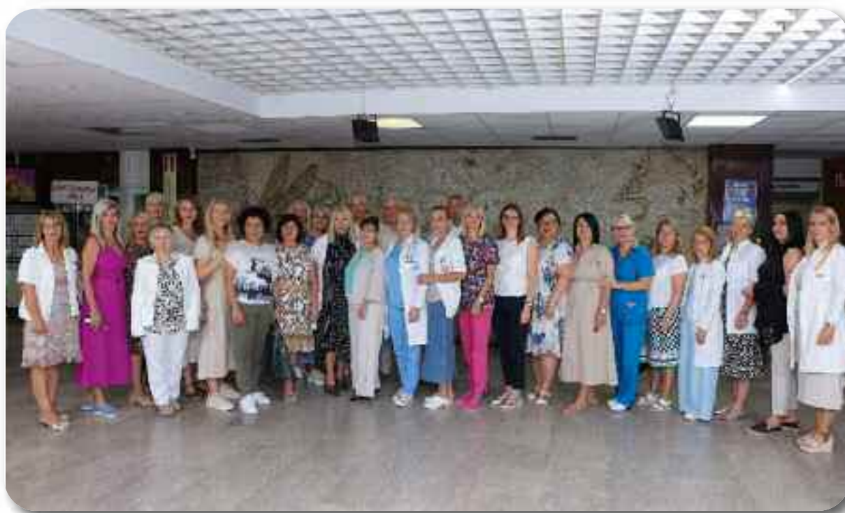
Лекари - педијатри Службе за здравствену заштиту деце и школске деце

У периоду од јуна месеца 2022. године до јула месеца 2025. године дато је 2751 доза ове вакцине. Такође, уведена је и имунизација вакцином против варичеле, као препоручене или по клиничким индикацијама и од 2019. године до 2025. године дато је 1555 доза.