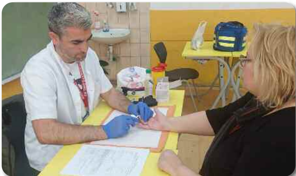
Одељење “Превентивни центар”