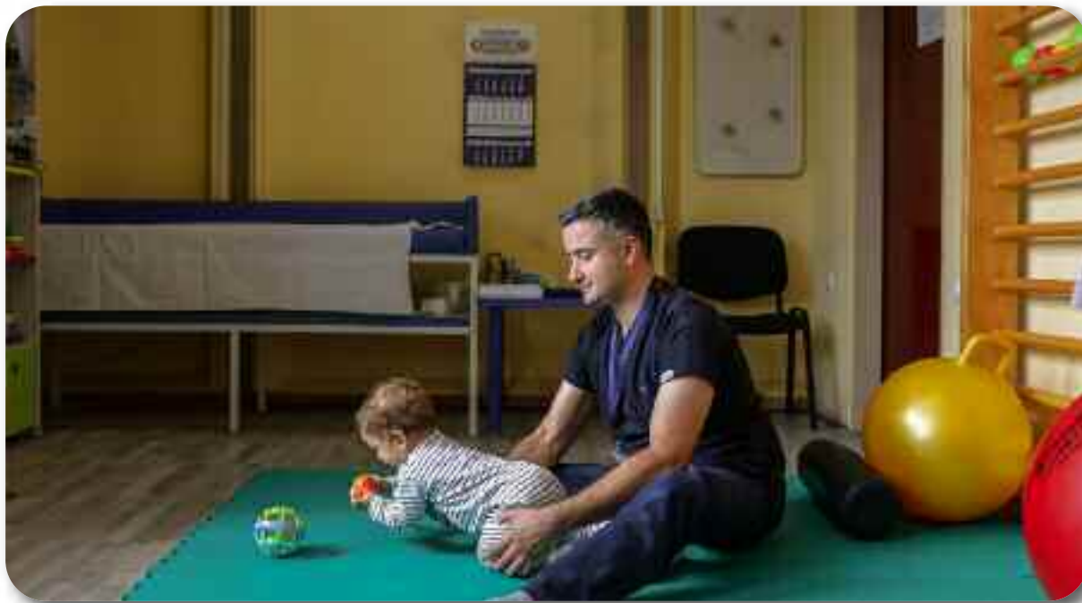
Вежбе за правилан раст и развој детета

Служба за физикалну медицину и рехабилитацију просторно је организована као: кинезитерапијски блок, електро-терапијски блок и термотерапијски блок.