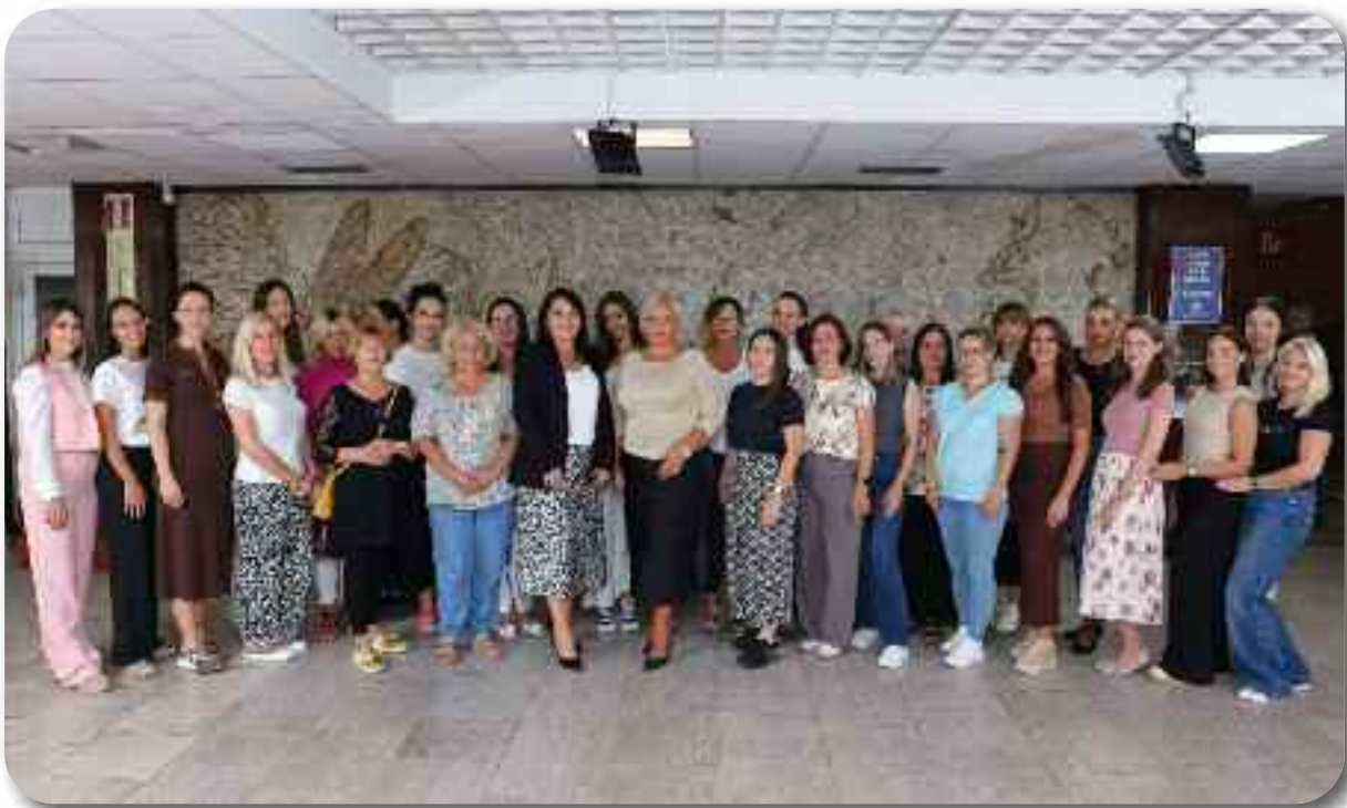
Служба поливалентне патронаже