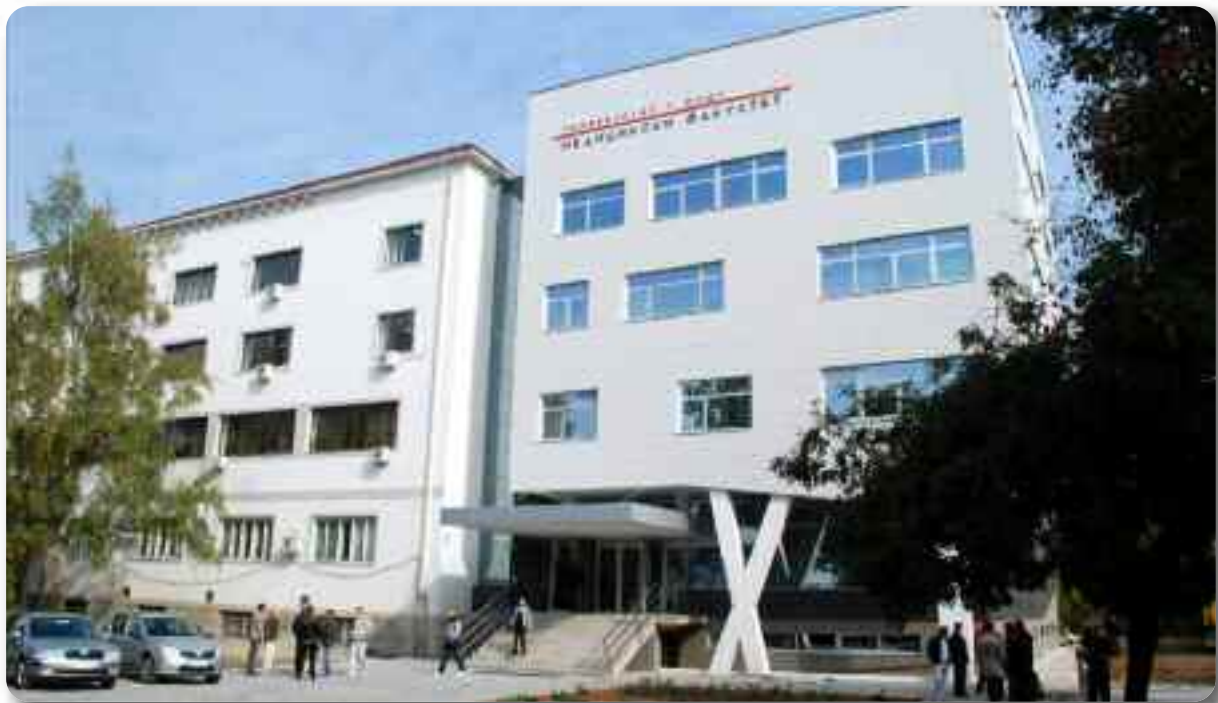
Универзитет у Нишу Медицински факултет

Студенти Медицинског факултета учествују у промотивним акцијама Дома здравља Ниш на разне теме, као и у активностима Саветовалишта за младе Дома здравља Ниш.