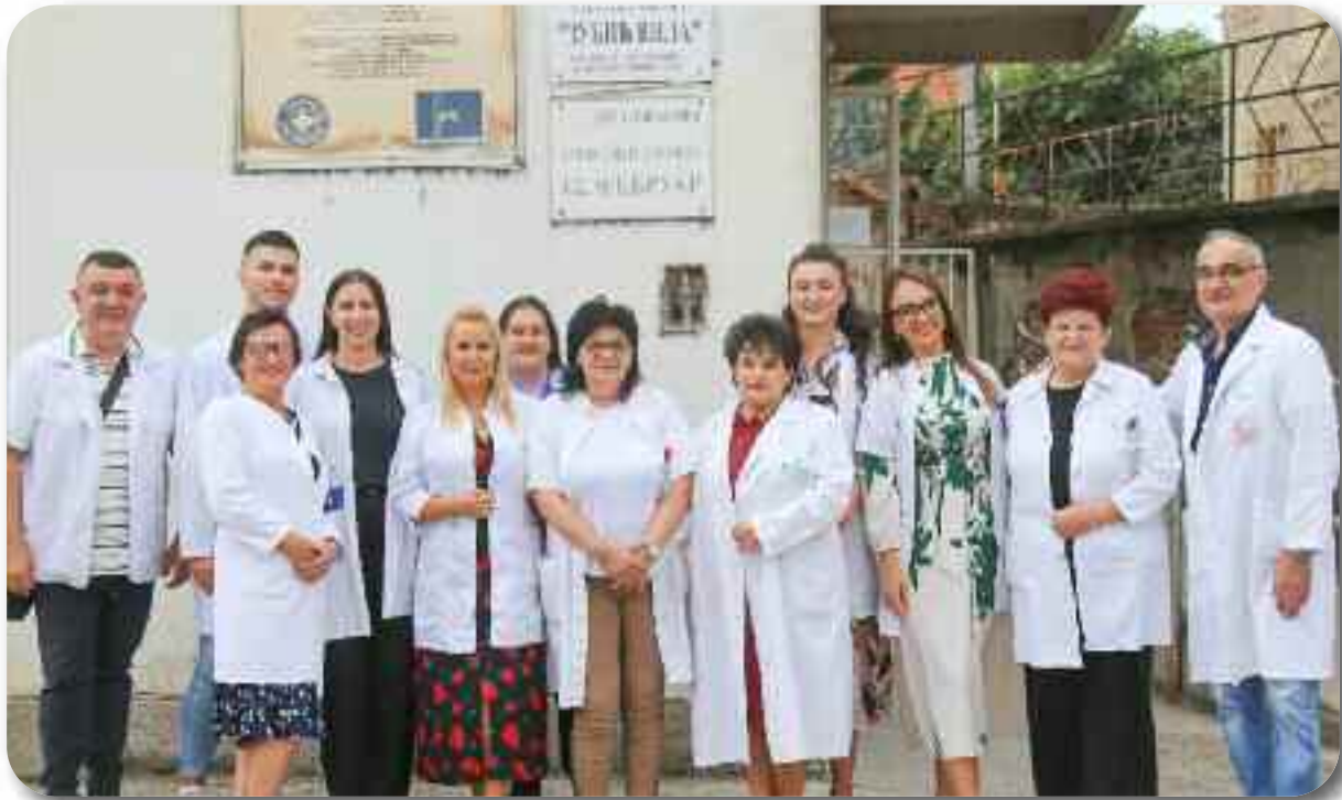
Одељење “12. фебруар”