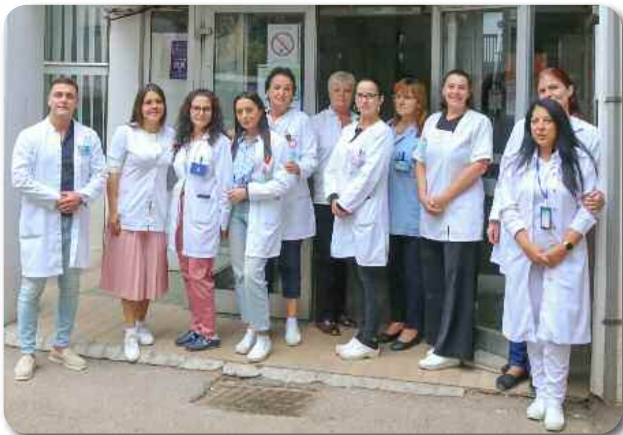
Одељење “Душко Радовић”