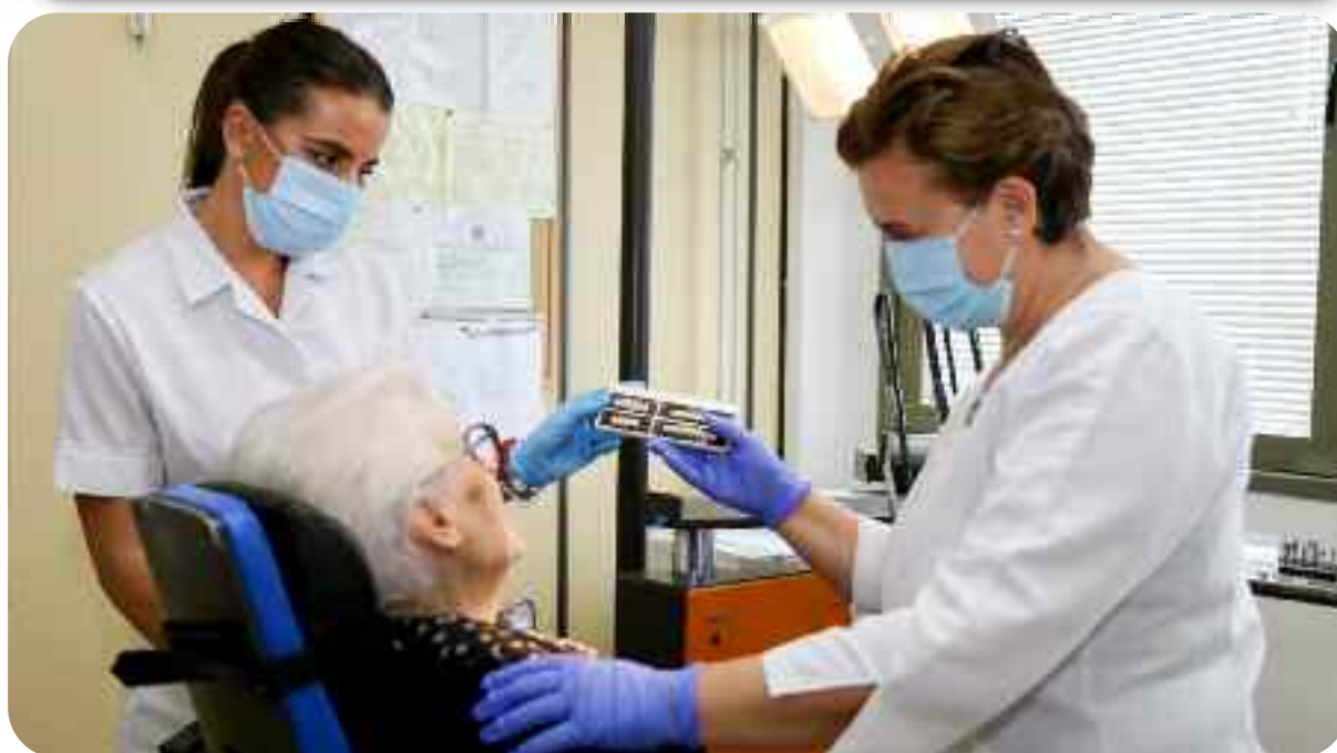
Стоматолошки прегледи - интервенције у Служби за здравствену заштиту у области денталне медицине