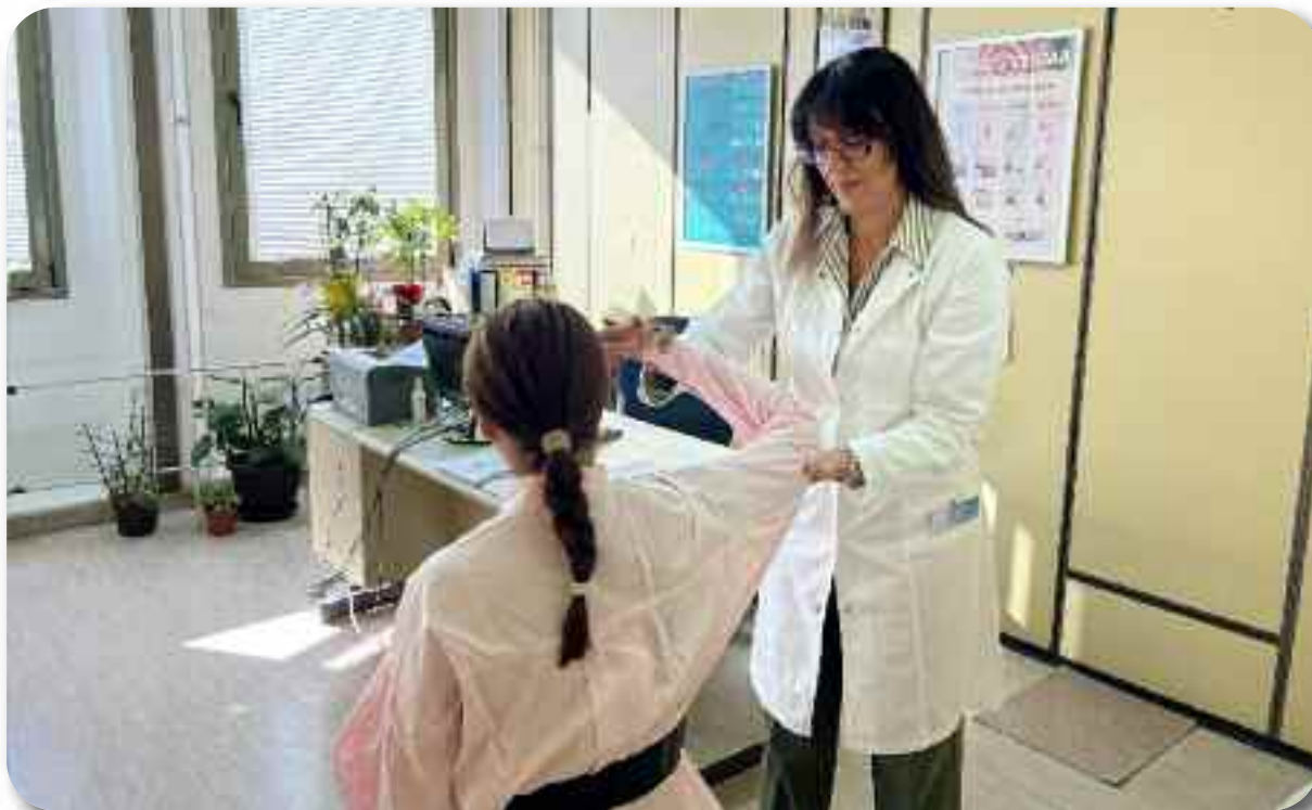
Преглед специјалисте физикалне медицине и рехабилитације

Посебно би истакли обележавање Међународног дана остеопорозе, Међународног дана физичке активности, Светског дана физиотерапеута, као и учествовање запослених на Базарима здравља у организацији Дома здравља Ниш.