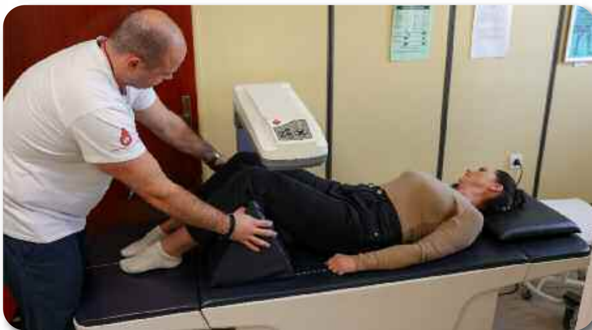
Мерење минералне густине костију – дензитометрија (DXA)