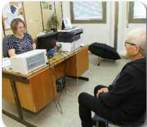
Преглед пацијента на одељењу неуропсихијатрије

У оквиру овог одељења од децембра 2013. године ради Саветовалиште за депресију, где се пацијенти могу обратити за помоћ сваке друге и четврте суботе у месецу, а од 2024. године и Саветовалиште за психолошку подршку онколошким пацијентима. Тим Саветовалишта чине психијатар, психолог, социолог и медицинска сестра.