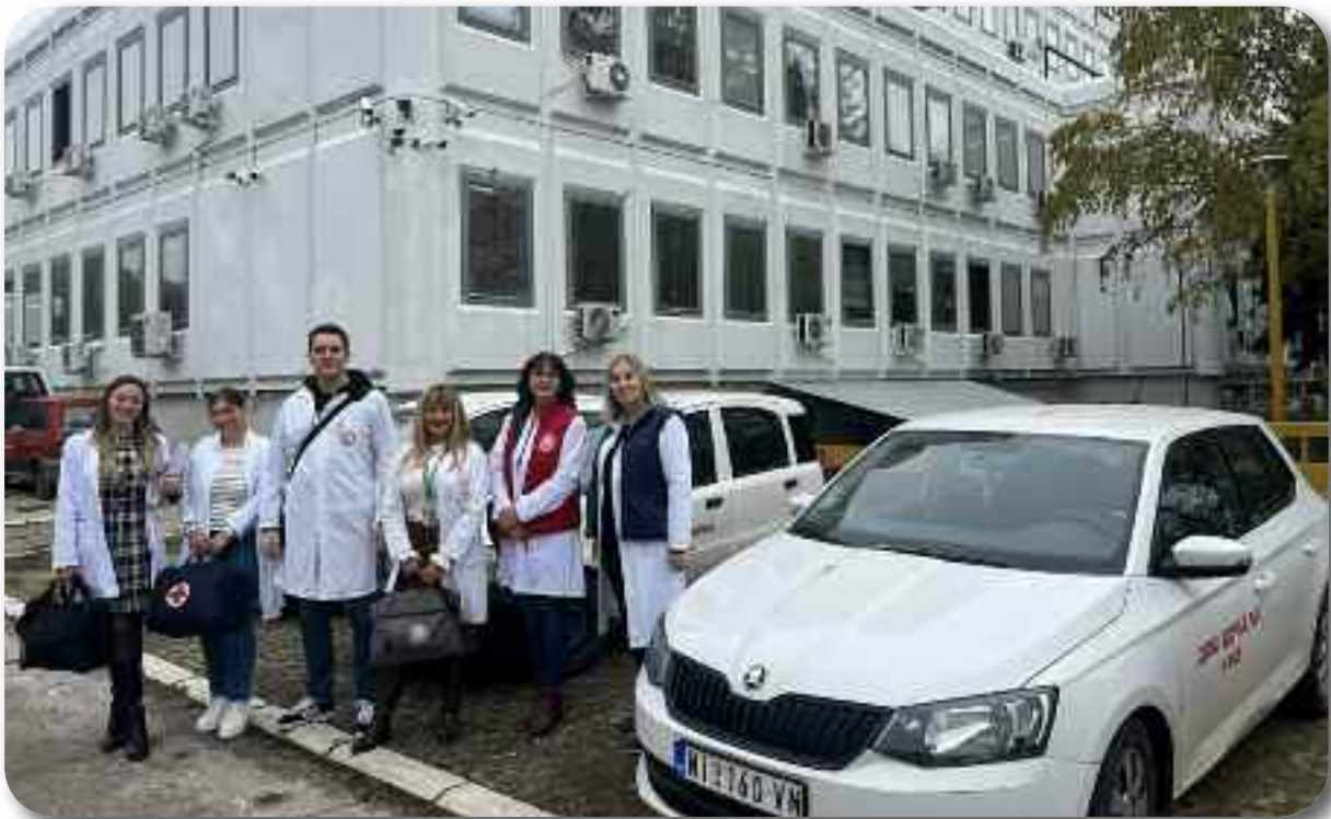
Полазак екипе на терен

Служба је наставила са радом на Интегрисаном сервису за стара и инвалидна лица - „Помоћ у кући“ у сарадњи са центром за социјални рад „Свети Сава“. Активна је сарадња са свим институцијама града, домовима за смештај старих и инвалидних лица, удружењима, а све у циљу помоћи заинтересованом становништву. На месечном нивоу Служба брине и лечи око 3.500 пацијената као и 500-900 нових пацијената упућених од стране изабраних лекара из Универзитетског Клиничког центра Ниш, Завода за здравствену заштиту радника Ниш као и Завода за здравствену заштиту радника “Железнице Србије”.