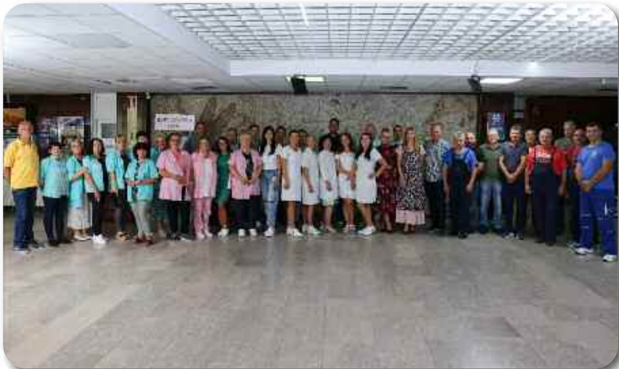
Служба за техничке и друге сличне послове