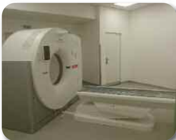
Уређај за компјутеризовану томографију плућа скенер

9. Лабораторијска дијагностика је добила 4 центрифуге за рад.