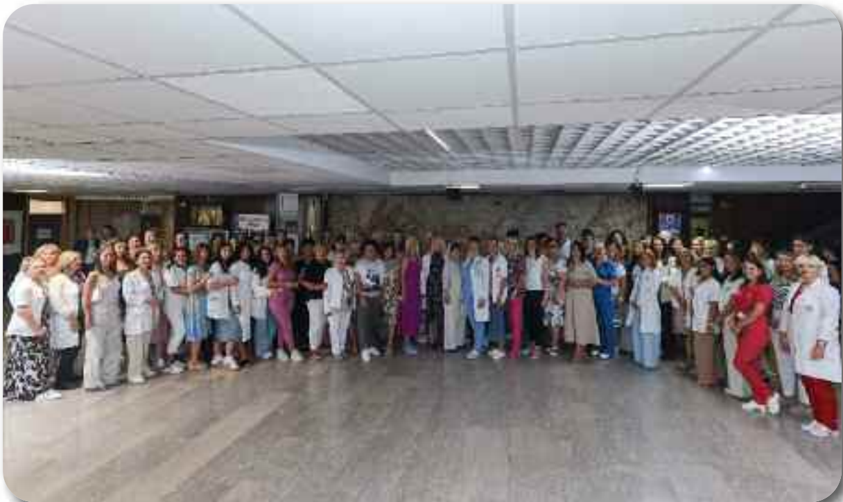
Служба за здравствену заштиту деце и школске деце