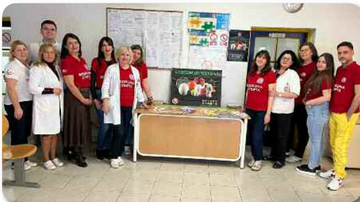
Акција Одељења медицине спорта “Спортом до здравља”