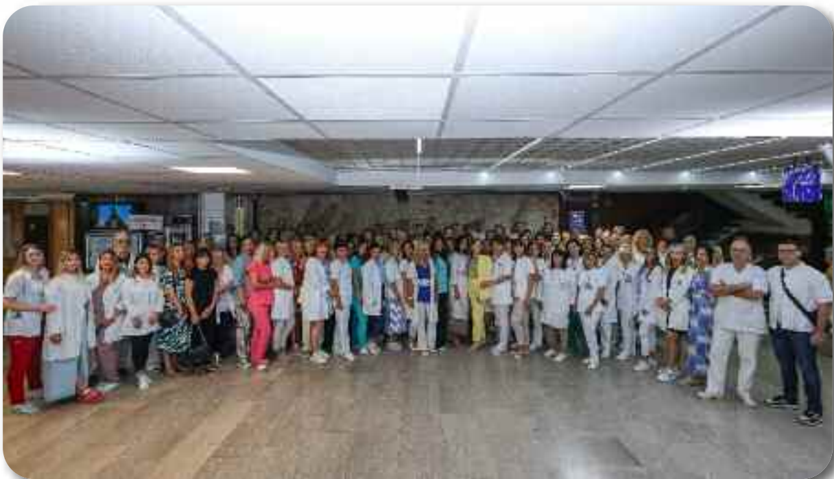
Служба за здравствену заштиту у области денталне медицине