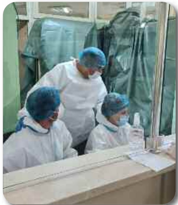
Директор у обиласку запослених у току пандемије COVID-19 инфекције