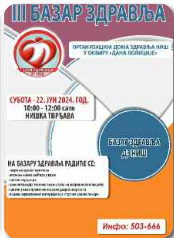
Постери са превентивних акција