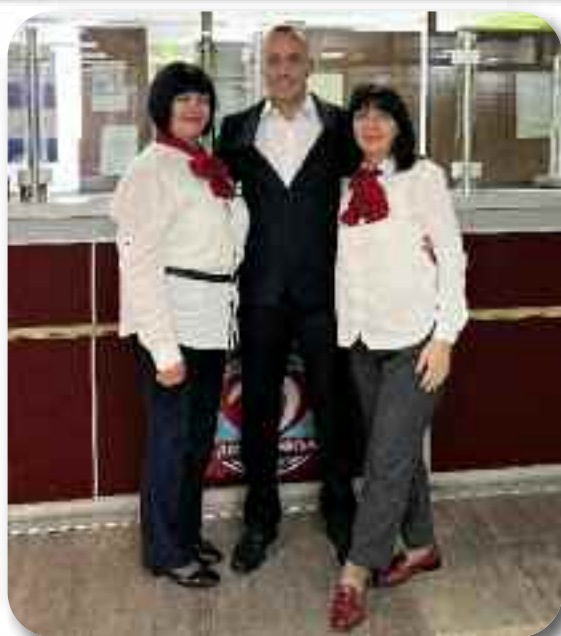
Запослени у техничкој служби