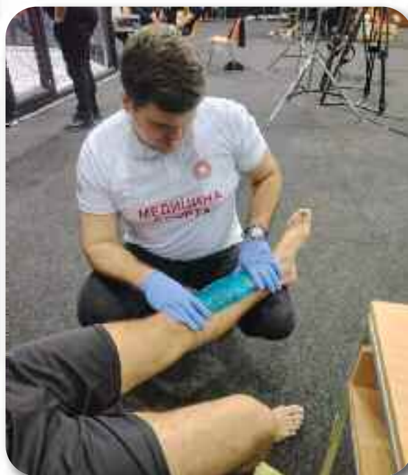
Медицинска подршка спортским дешавањима одељења Медицине спорта