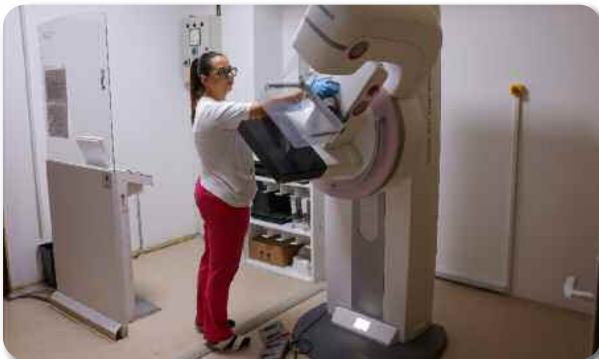
Рендген апарат за снимање дојке - мамограф