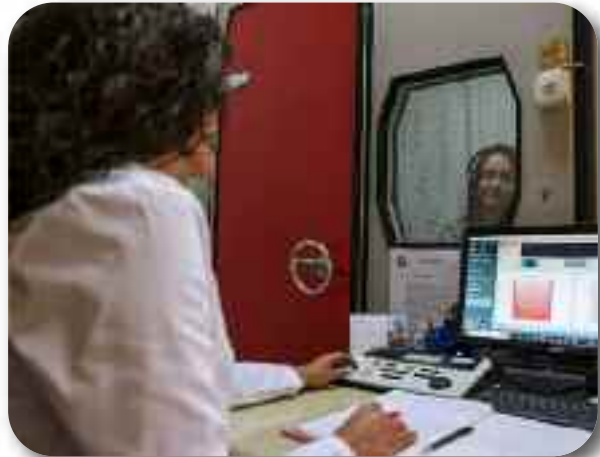
Провера слуха - аудиометрија

У фокусу је стално стручно усавршавање запослених, чиме се осигурава висок ниво здравствене заштите и усклађеност са најсавременијим медицинским стандардима.