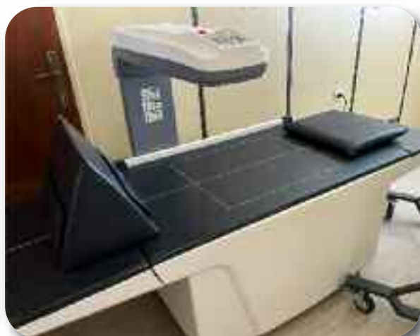
Уређај за мерење минералне густине гостију денситометар - (DXA)