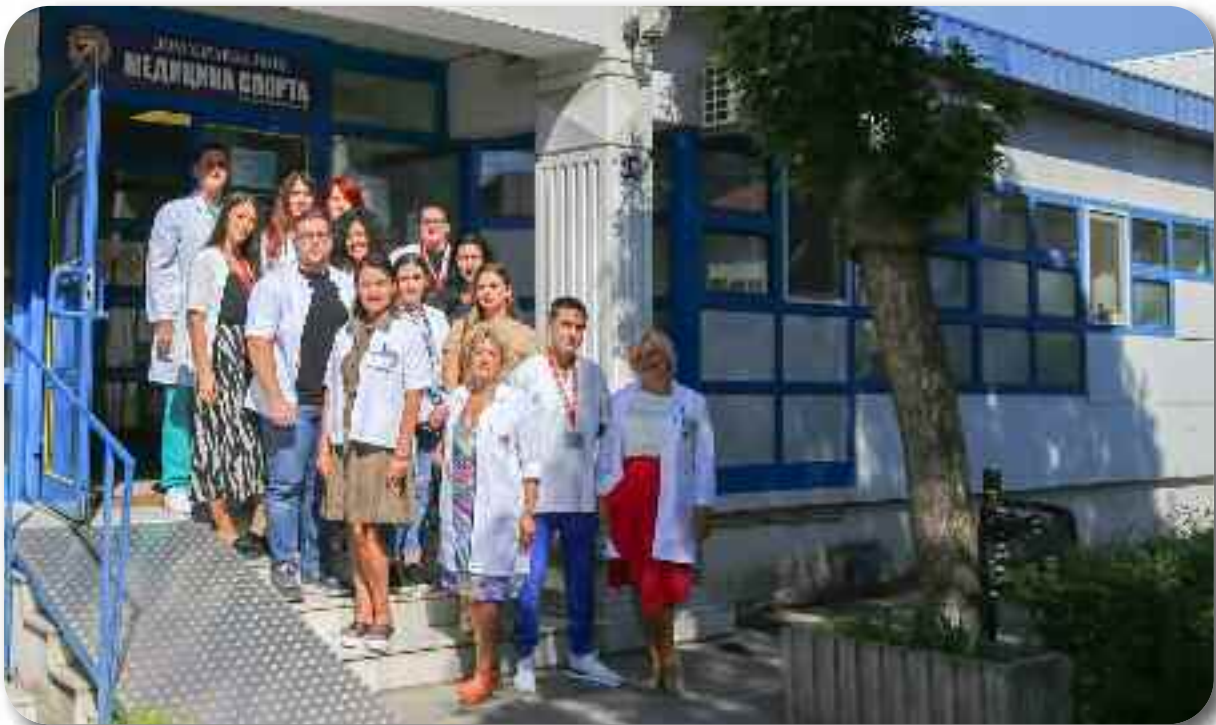
Одељење медицине спорта