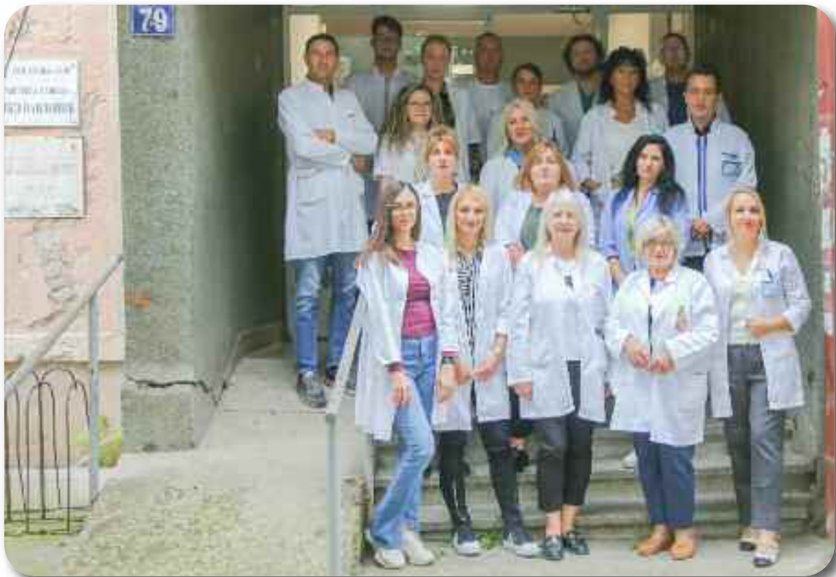
Одељење “Ратко Павловић”