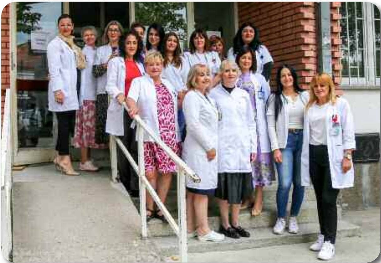
Одељење “Делијски вис”