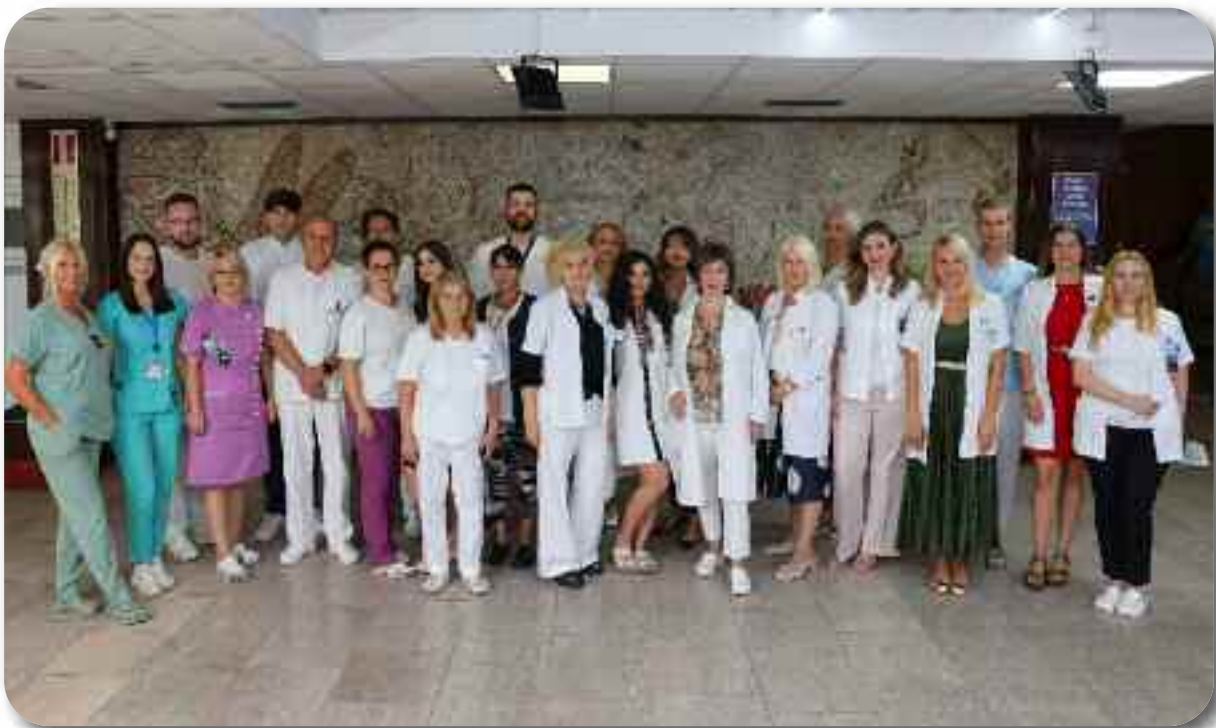
Служба за радиолошку дијагностику