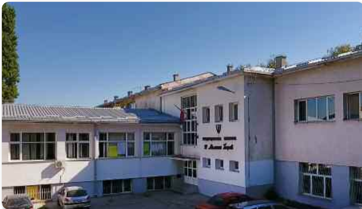
Медицинска школа “Др Миодраг Лазич” Ниш

На годишњем нивоу организује се обилазак установе за ђаке Медицинске школе да би се упознали са организацијом и процесом рада због будућег позива.