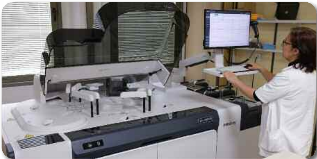
Рад лабораната на аутоматском биохемијском анализатору

На годишњем нивоу Служба прима преко 200.000 пацијената и уради се преко 2.400.000 анализа. Лабораторија ради свакодневно, а резултати лабораторијских анализа доступни су пацијентима у току истог дана.