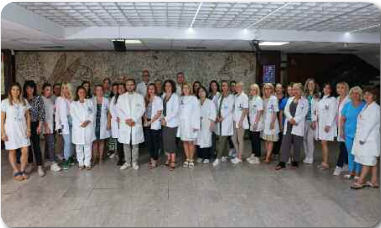
Служба за здравствену заштиту жена