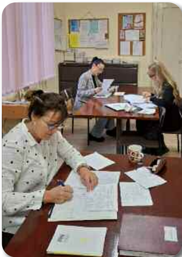
Припрема за одлазак на терен вођење медицинске документације