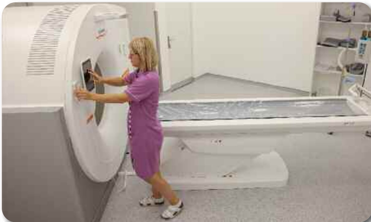
Уређај за компијутеризовану томографију плућа - скенер